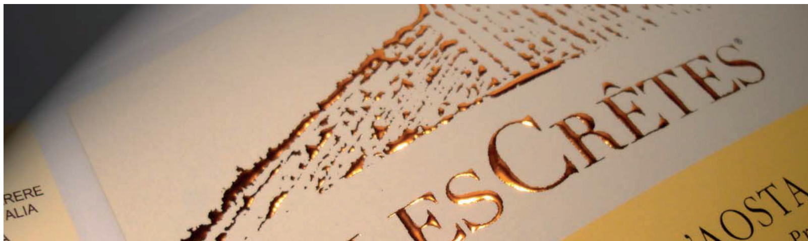
DETALUXE RAME E ORO per la linea classica.