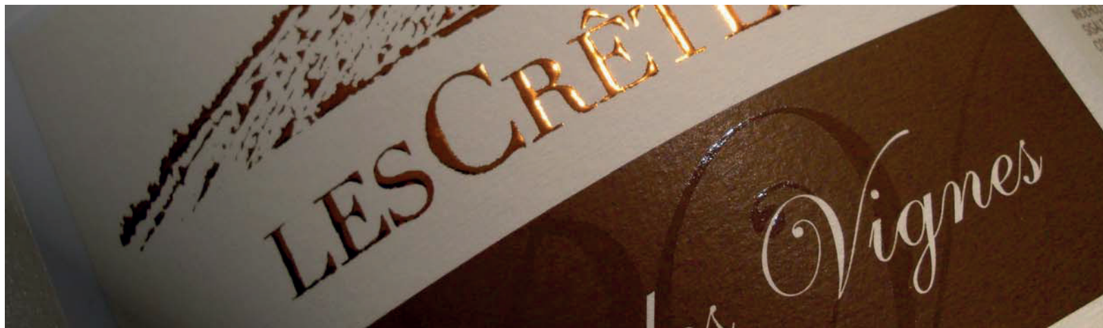
DETALUXE RAME E VERNICE LUCIDA per i vini da tavola.